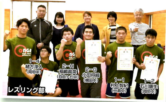
令和元年度 第55回全九州高等学校レスリング新人選手権大会 (1/31~2/2 於: 鹿児島県) 祝 九州大会出場 ※学年・クラスは昨年度